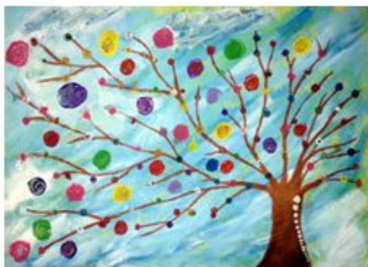
Софија Никодијевић 7-1