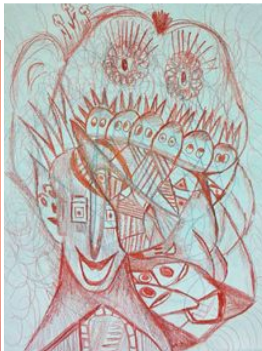
Милош Милошевић 8/3