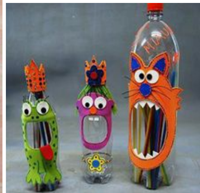
кутије за оловке од флаша