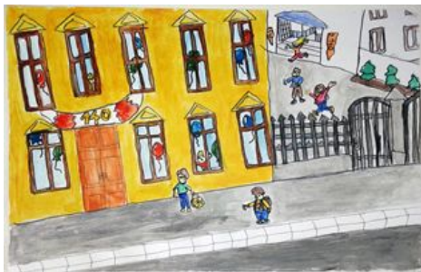
Младен Ђурчија 6/2

Драга школо, срећан ти рођендан! Желим ти још много овако лепих и успешних година, овако добрих наставника и дивне деце.