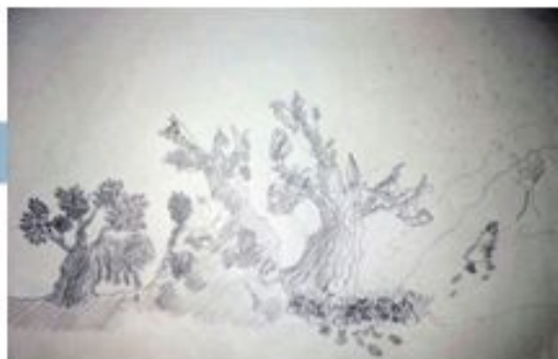
Дејан Тешић 7-3