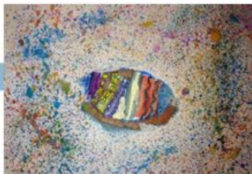
Симона Круезиу 5-4