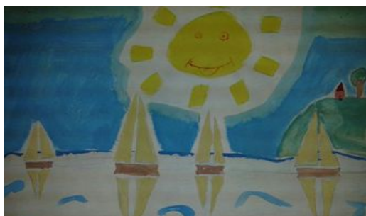
Катарина Кантар 3/1