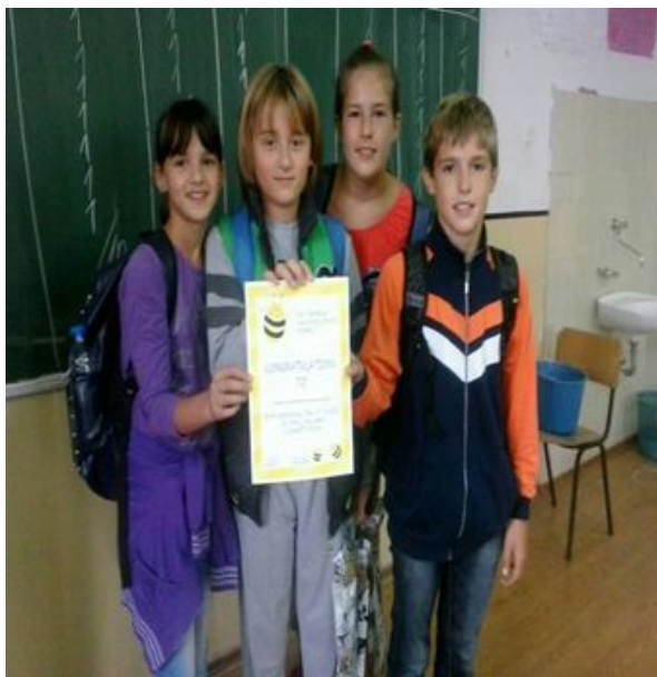
Победници у спеловању - ученици 6/2