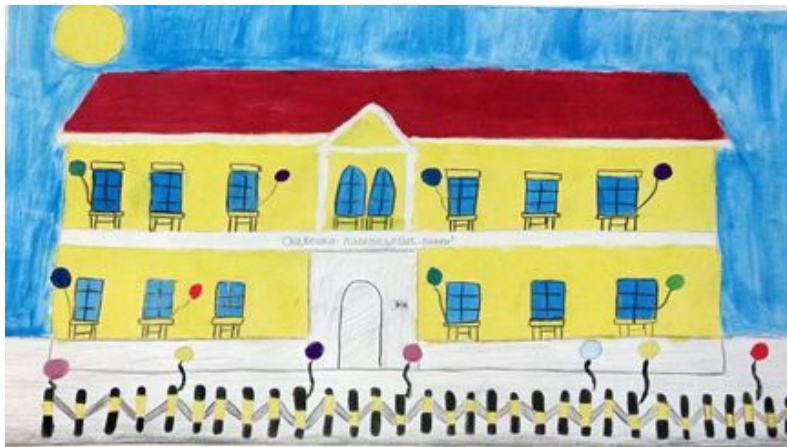
Данијела Медић 5/3