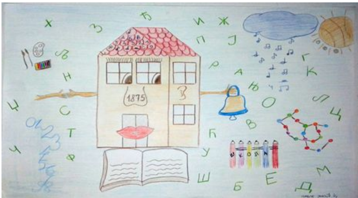
Павле Јокић 5/1