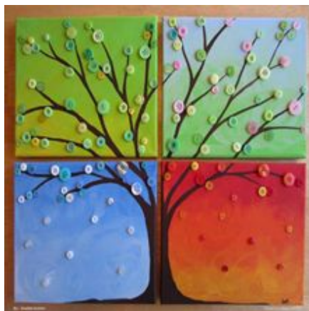
дрво са дугмићима