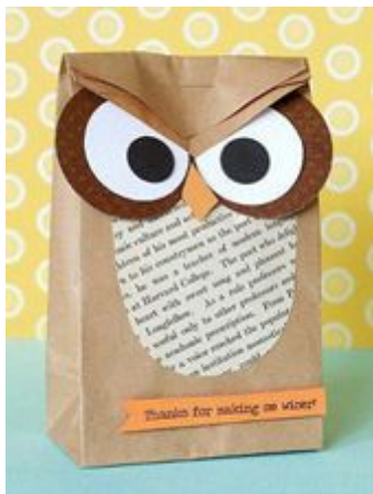
кеса за поклон у облику сове