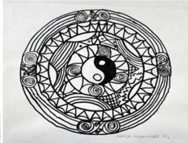
Надија Ибраимовић 7/2