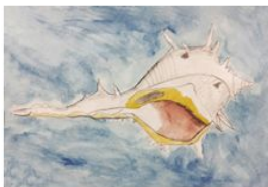
Немања Радовић 5-3