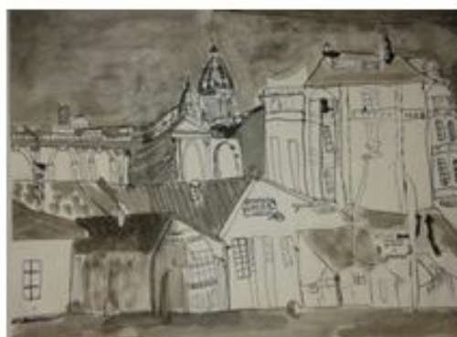
Наташа Риђошић 6-4