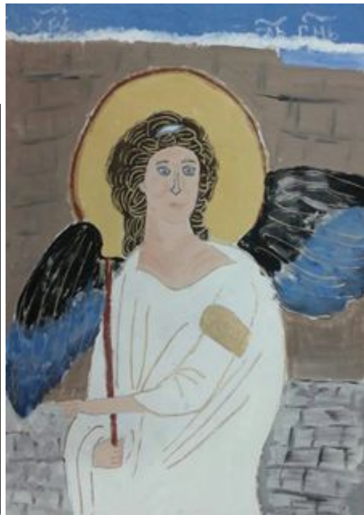
Магдалена Скорупан 6/3