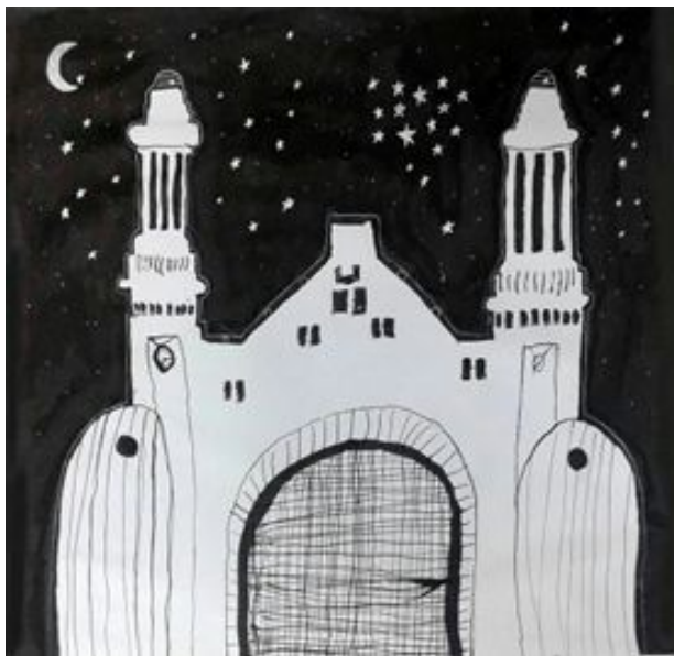
Стефан Пекеч 6/1